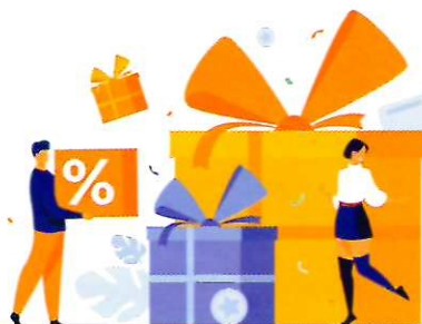
МОШЕННИЧЕСТВО ЧЕРЕЗ ЭЛЕКТРОННУЮ ПОЧТУ