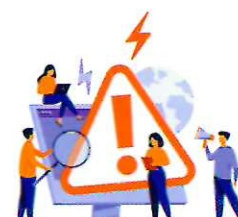
МОШЕННИЧЕСТВО ЧЕРЕЗ ПРОГРАММЫ И ПРИЛОЖЕНИЯ