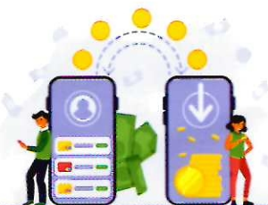
МОШЕННИЧЕСТВО ЧЕРЕЗ СМАРТФОН