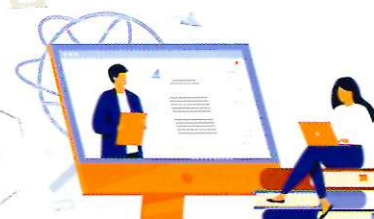
МОШЕННИЧЕСТВО ЧЕРЕЗ СОЦИАЛЬНЫЕ СЕТИ И МЕССЕНДЖЕРЫ

ИЛИ КАК НЕ НАСТУПАТЬ НА ОДНИ И ТЕ ЖЕ ГРАБЛИ