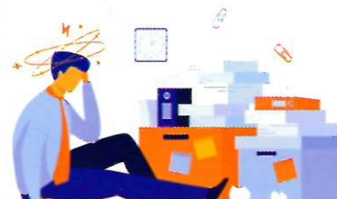
МОШЕННИЧЕСТВО ДРУГИЕ ВИДЫ