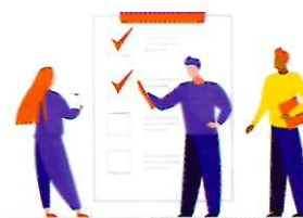
МОШЕННИЧЕСТВО ЧЕРЕЗ СЕРВИС ОБЪЯВЛЕНИЙ