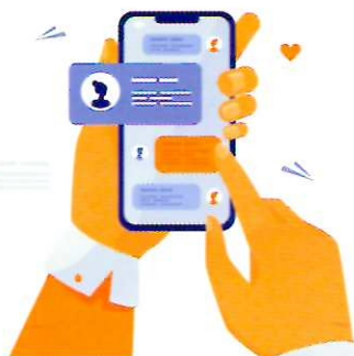
МОШЕННИЧЕСТВО ЧЕРЕЗ СМС